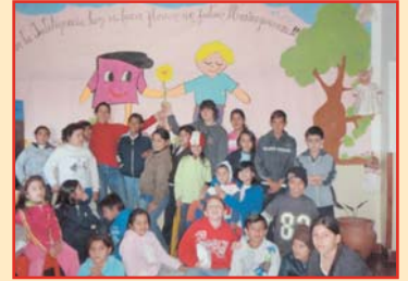
Las Lauras en Formosa.

Reconocemos la labor de esa infinidad de personas anónimas que dedican su tiempo y su vida a acabar con la pobreza, personas entregadas que hacen de su vida una historia de esperanza”.